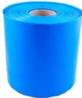
Rys 3. Przykładowa taśma zabezpieczająca, rozwijana pod kablami elektroenergetycznymi o napięciu znamionowym do 1 kV