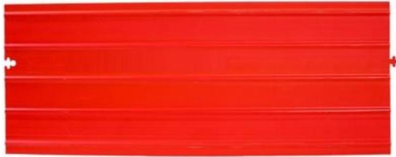
Rys 4. Widok przykładowej płyty ochronnej