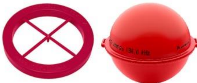
Rys 5. Widok przykładowych znaczników elektromagnetycznych

znacznika elektromagnetycznego pod kablem. Maksymalną dopuszczalną głębokość ułożenia znaczników elektromagnetycznych określa producent.