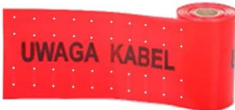
Rys 2. Taśma ostrzegawcza dla kabli elektroenergetycznych o napięciu wyższym niż 1 kV

Uwaga: dopuszcza się szerszy zakres informacji po ustaleniu tego z PKP PLK S.A.